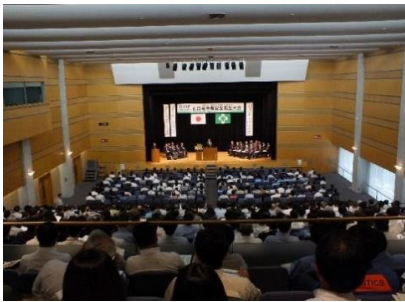
山口県産業安全衛生大会