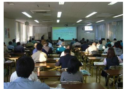
過重労働対策セミナー