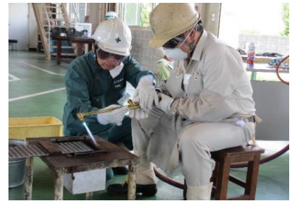
ガス溶接技能講習の実習風景