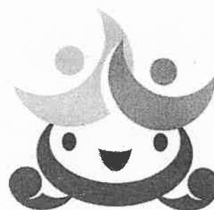
誰もが活躍できるやまぐちの企業